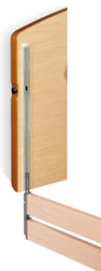
>>> Barandillas de fácil instalación