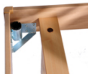
>>> Sujeción para incorporador y portasueros