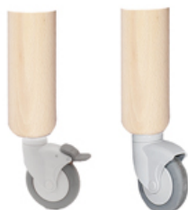
>>> Patas con ruedas OPCIONALES con freno o sin freno