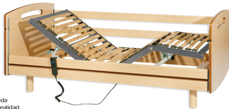
Version C cabecero+piecero