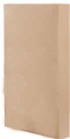
>>> Sistema de embalaje